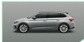
Smoky Diamond Silver