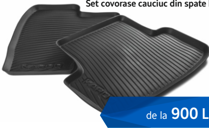
Set covorase cauciuc din spate KAROQ