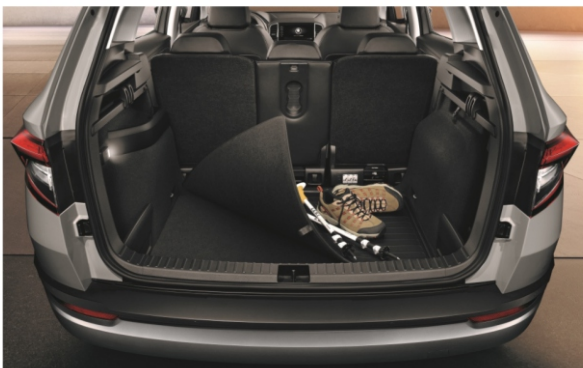
Covorasa pentru portbagaj cu fata dubla KAROQ (cu roata de rezerva)