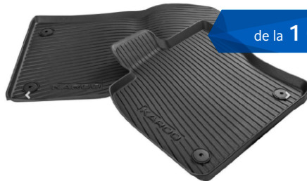
Set covorase cauciuc din spate KAROQ