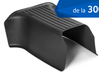
Covorasa tunel spate din cauciuc