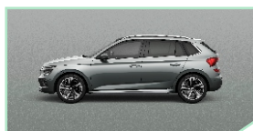
Smoky Diamond Silver