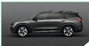
Graphite Grey - 500 €