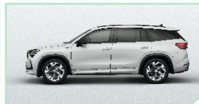
Moon White - 500 €