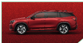
Velvet Red - 800 €