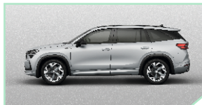
Brilliant Silver - 500 €