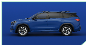
Energy Blue - 0 €