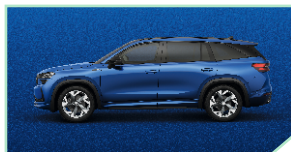
Race Blue - 500 €