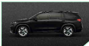
Magic Black - 500 €