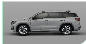
Steel Grey - 500 €