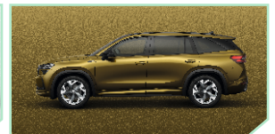
Bronx Gold - 500 €