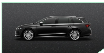
Magic Black - 400 €