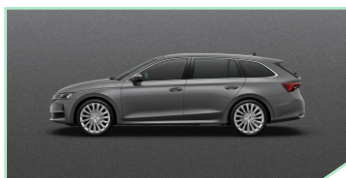
Graphite Grey - 400 €