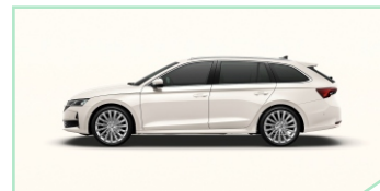
Candy White - 400 €