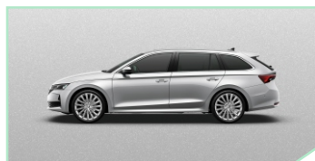
Brilliant Silver - 400 €