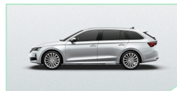
Moon White - 400 €