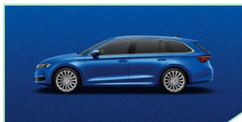
Race Blue - 400 €